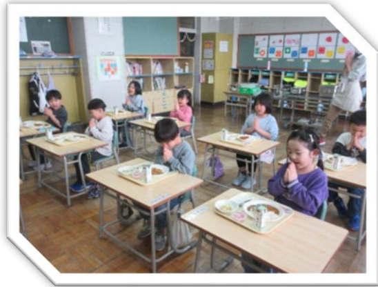
4月13日（月） 1年生初めての給食

子どもたちの安全を守ることは、学校だけでは成し得ることはできません。学校・家庭・地域が一体となり、子どもたちが安心して学び、成長できる環境をつくっていくことが何よりも大切となります。今後とも、皆様のご理解とご協力をよろしくお願いいたします。