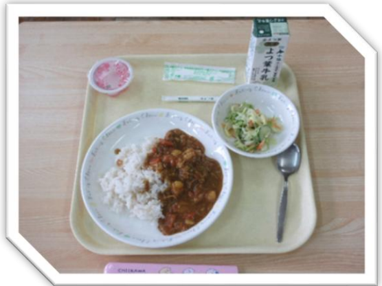
【メニュー】 麦ごはん、チキンカレー、キャベツのクリーミーサラダ、お祝いデザート、牛乳