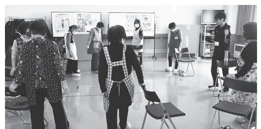
▲認知症予防体操の様子

問合せ先 保健福祉課保健係(保健センター内) ☎53・3155 Eメール:hoken@town.tsukigata.hokkaido.jp