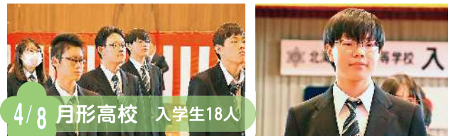
4/8 月形高校 入学生18人