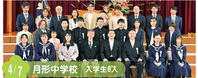
4/7 月形中学校 入学生8人