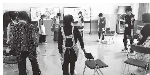
▲認知症予防体操の様子

問合せ先 保健福祉課保健係(保健センター内) ☎53・3155 Eメール:hoken@town.tsukigata.hokkaido.jp