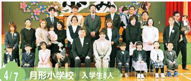
4/7 月形小学校 入学生8人