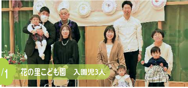
4/1 花の里こども園 入園児3人