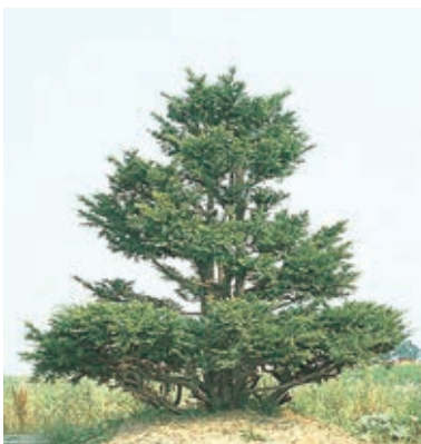
ちょうぼく 町木 (イチイ)