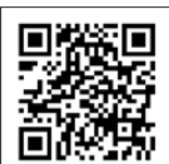
▲月形グラフィティ紹介ページ

農業を通して、ベルデくんと町のことが大好きな人々との掛け合いで心がほっこりするお話をお届けしています。