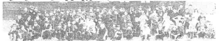
今年で3回目となった小中高合同の町内清掃活動。月高生が指示を出し、協力してゴミを集めました。