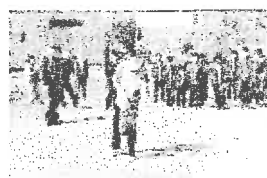
消火訓練も行いました