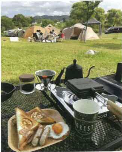
@kosiro.kosiro 様 (釧路市)