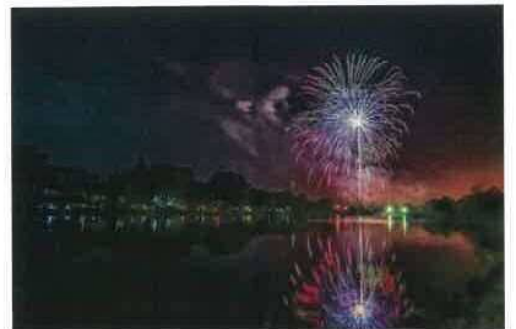
我妻 睦美 (@waga_623) 様 (奈井江町)