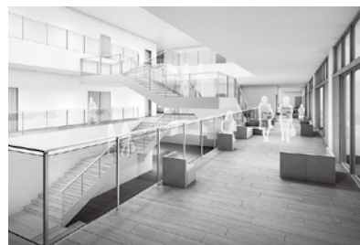
■吹き抜けイメージ