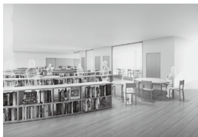
■メディアセンターイメージ