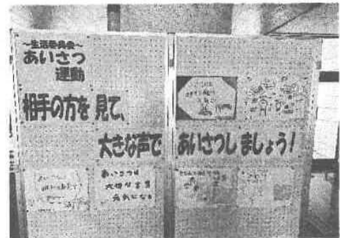
<生活委員会 あいさつ運動>

ある子は、にこやかな表情で私を見つめながら、「校長先生、おはようございます」と元気よく言ってくれます。そのようなあいさつをしてくれると、その子供の「おはようございます」の言葉が光となり、私の心に広がってくるのを感じます。また、ある子は決して大きな声ではないのですが、「おはようございます」の言葉に強い思いが込められていることを感じ、私の気持ちも清らかになります。