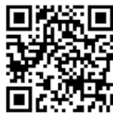
月形町ホームページ QRコード