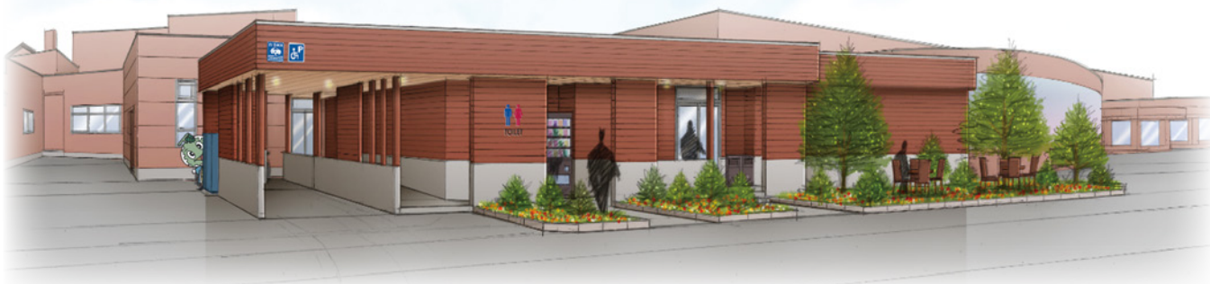
24時間トイレレイアウト図

24時間トイレには、男性用（洋式3基、小5基）、女性用（洋式8基）のほか、オストメイト対応の多目的トイレ（1室）、小さいお子様連れの方にも安心な、おむつ交換シートなどを有した授乳室も完備します。