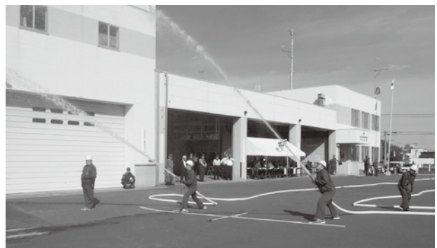
月形消防演習のようす