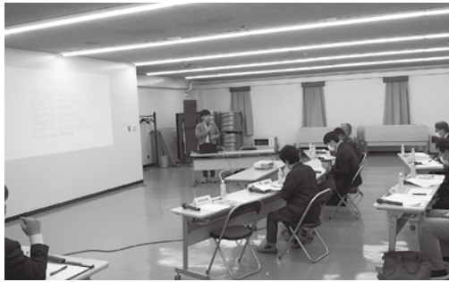
第1期 ふるさと活性化運営協議会のようす

補助額 ・町内事業者 補助対象経費の10分の9以内（上限額100万円） ・町外事業者 補助対象経費