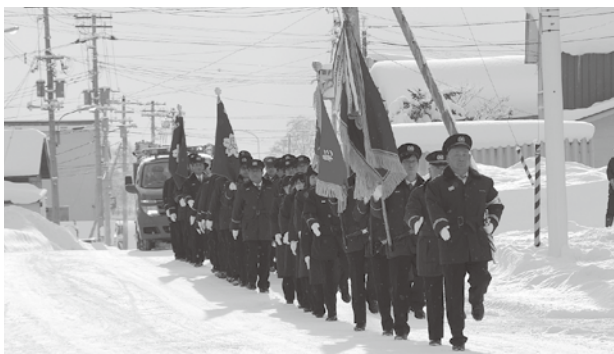
月形消防出初式のようす