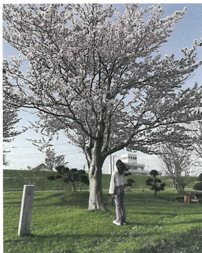
竹内 萌 様(月形町)