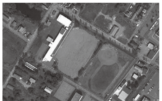
▲月形中学校敷地 (航空写真)