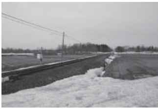
▲旧知来乙駅周辺の農地

・町の管理地が飛び地で残るような場合は、町が残地管理を行うことが困難となりますので、そのような土地の譲渡は行いません ・譲渡希望者との協議は、必要性を十分検討し、地域の意見を踏まえ対応します