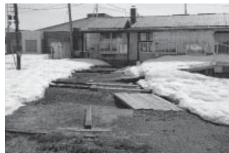
▲旧石狩月形駅舎裏

鉄道施設によって動線が悪い地域については、町道の新設や道路拡幅などを実施し、住民生活の利便性向上を図ります。