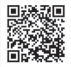
▲中間市のふるさと納税