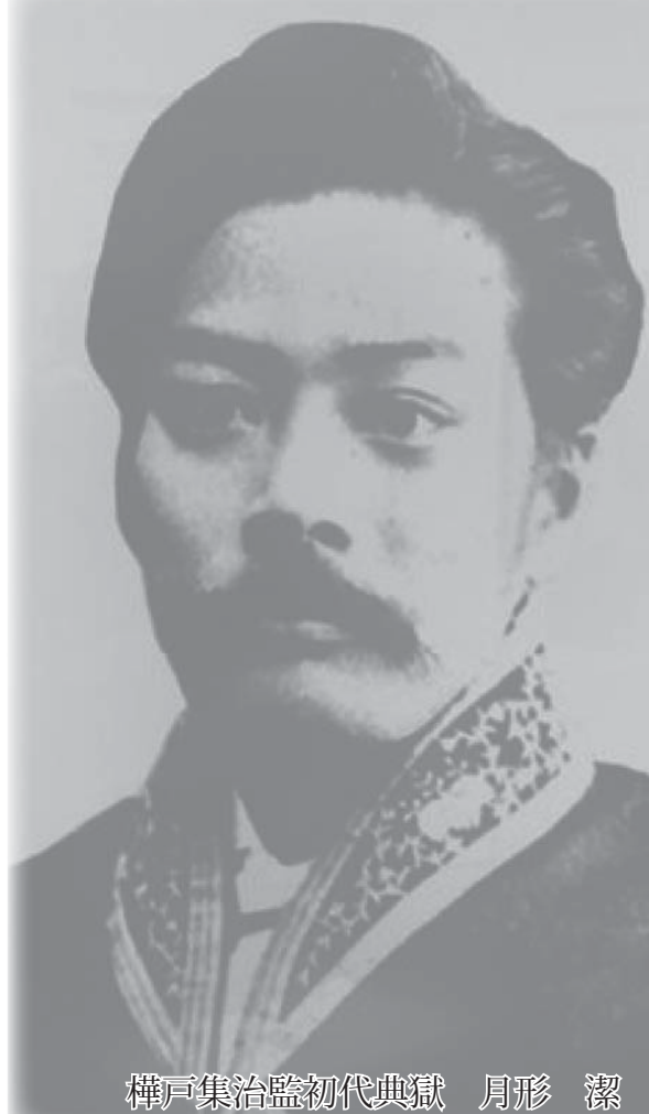
樽戸集治監初代典獄 月形 潔